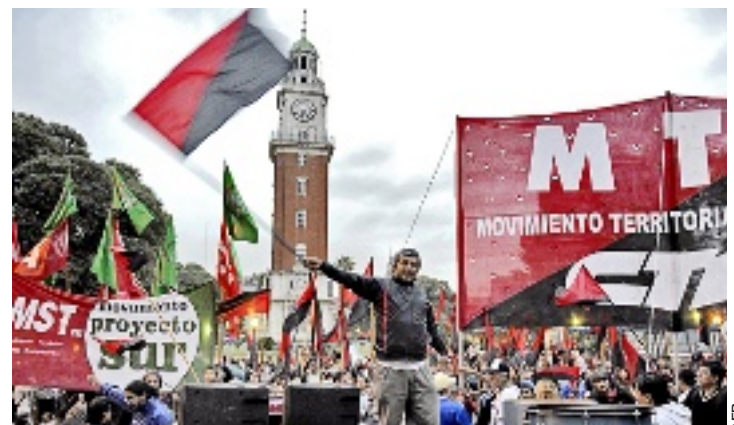
► Un centenar de personas se movilizó ayer en Buenos Aires para expresar su rechazo a la presencia del escritor peruano en la capital.

Pero la presencia de Vargas Llosa fue objetada por intelectuales